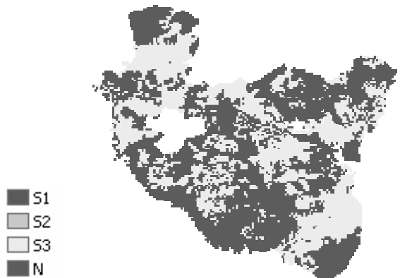
Fig.2– Land Suitability per il frumento duro nella provincia di Settat per il 2080, scenario climatico A2dell'IPCC, Hadley Center.