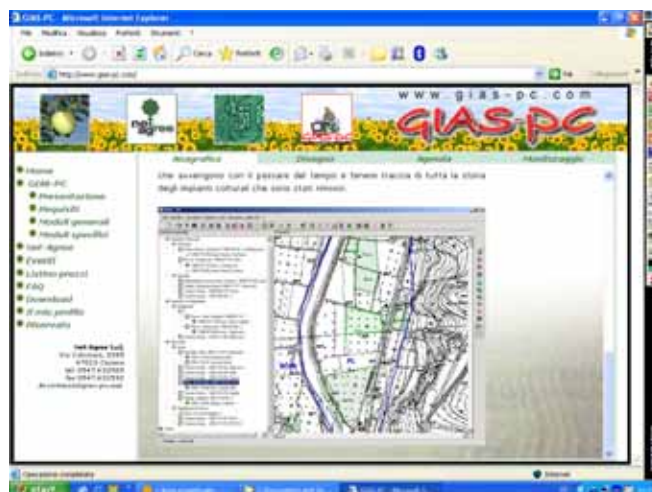
Fig.1 - GIAS: Sistema per l'assistenza tecnica aziendale realizzato dall'Assessorato Agricoltura dell'Emilia-Romagna. Il sistema si basa sull'uso di un personal computer aziendale con collegamento alle banche dati regionali. L'irrigazione viene stimata utilizzando un modello di bilancio idrico, la carta regionale dei suoli e i dati meteorologici forniti da Arpa-Sim.

La ricerca e l'evoluzione tecnologica hanno portato alla messa a punto di metodologie di monitoraggio dello stress idrico via via più complesse e senza dubbio più precise, come la tecnica del sap flow o dell'analisi micromorfologica dei frutti, dove in entrambi i casi lo stress idrico viene rilevato direttamente sulla pianta (Cohen, 1994), oppure il metodo del Crop Water Stress Index (I-dso, 1982; Anconelli et al., 2000), che utilizzando la misura della radiazione infrarossa basa la sua stima sulla