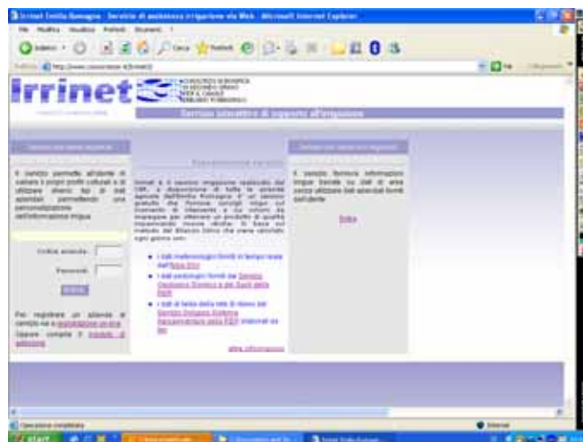
Fig. 2 - Irrinet: Sistema per l'assistenza irrigua sviluppato dal Consorzio di Bonifica di 2° Grado per il Canale Emiliano-Romagnolo. Il bilancio idrico aziendale viene aggiornato dal server centrale situato presso il consorzio. Sistemi simili sono disponibili per diverse regioni italiane.

Fig.1- GIAS: A technical farm support service, developed by Emilia-Romagna Agricultural Department. The system is based on a personal computer link to the regional database. The system uses a water balance model, the regional soil map and meteorological data by Arpa-Sim to estimate crop irrigation requirements.