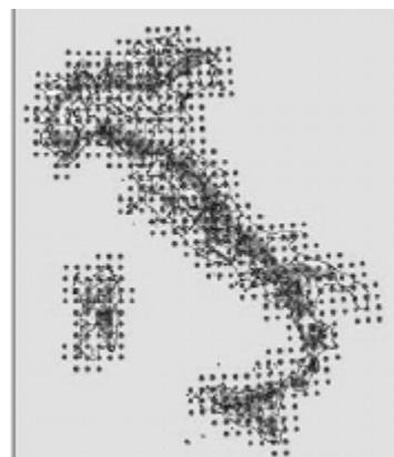
Fig.1 – Nodi di griglia distribuiti sul territorio nazionale.

Per l'analisi climatica si sono utilizzati dati meteorologici ricavati dalla Banca Dati Agrometeorologica Nazionale del Sistema Informativo Agricolo Nazionale (SIAN) adeguatamente spazializzati su griglia di 30 x 30 km e ricoprente l'intero territorio nazionale. Tali dati derivano da attività operative del SIAN di “Analisi Oggettiva” basata su tecniche geostatistiche di spazializzazione ( Kriging ). Sono state acquisite, pertanto, le serie complete dei valori giornalieri di temperatura dell'aria (minima e massima), precipitazione piovosa, eliofania, umidità relativa e velocità del vento (a 10 m) stimati su 544 punti (nodi di griglia), distribuiti in modo uniforme su tutto il territorio nazionale dal 1951 al 2006 (fig.1).